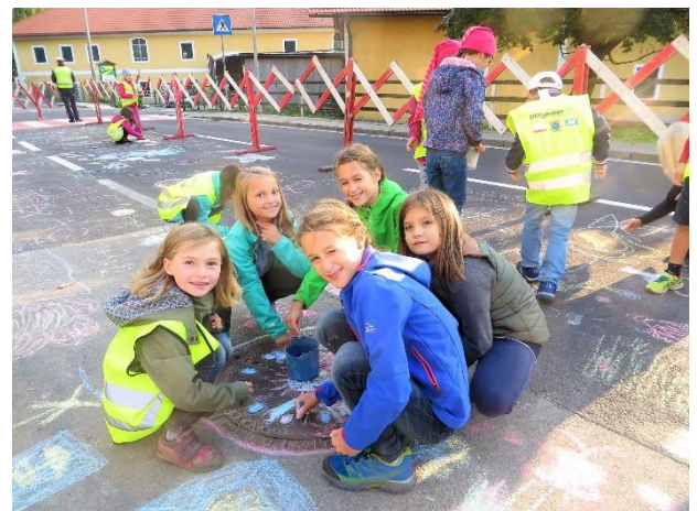
VolksschülerInnen malen im abgesicherten Bereich

Durch die Verschönerung eines Straßenabschnittes wird die Straße als öffentlicher Raum sichtbar gemacht, der für ALLE VerkehrsteilnehmerInnen da ist.